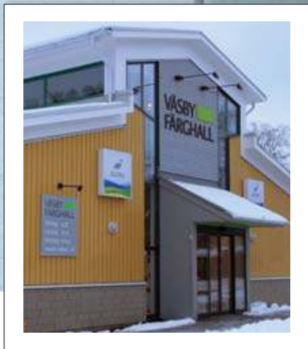
Väsby Färghall – ett tempel för inspiration och inredning!

omkring i färghallen. Eller snarare att framhäva sin personlighet. Vare sig det handlar om väggar, gamla möbler eller tavlor så är det den egna prägel man sätter. Och eftersom man skall leva med väggarna, möblerna, tavlorna en längre tid så gäller det att hitta sin stil.